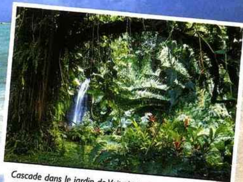
Cascade dans le jardin de Vaipahi à Mataiea Côte Ouest, Tahiti.