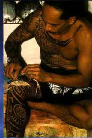
Homme tressé fabrique un objet en pandanus et bois corail