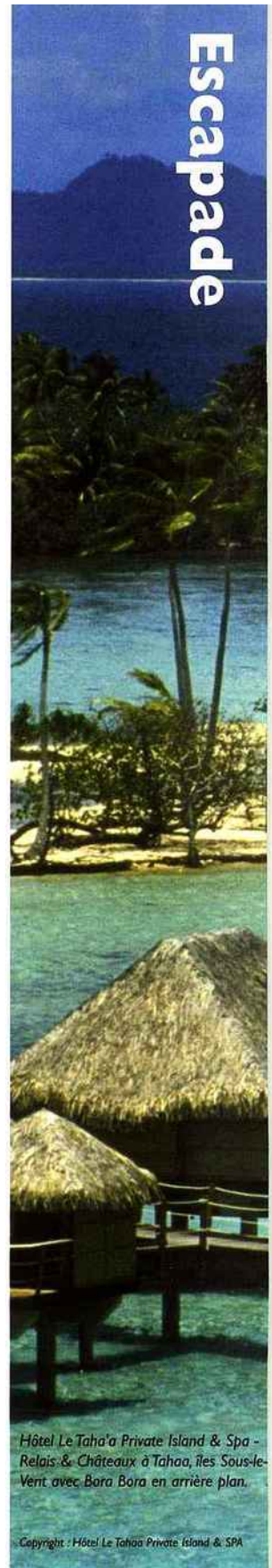
Hôtel Le Taha'a Private Island & Spa - Relais & Châteaux à Tahaa, îles Sous-le- Vent avec Bora Bora en arrière plan.

Le Musée de Tahiti et des Iles est situé dans un grand parc de 3 hectares en bordure de mer à Punaauia à Tahiti.