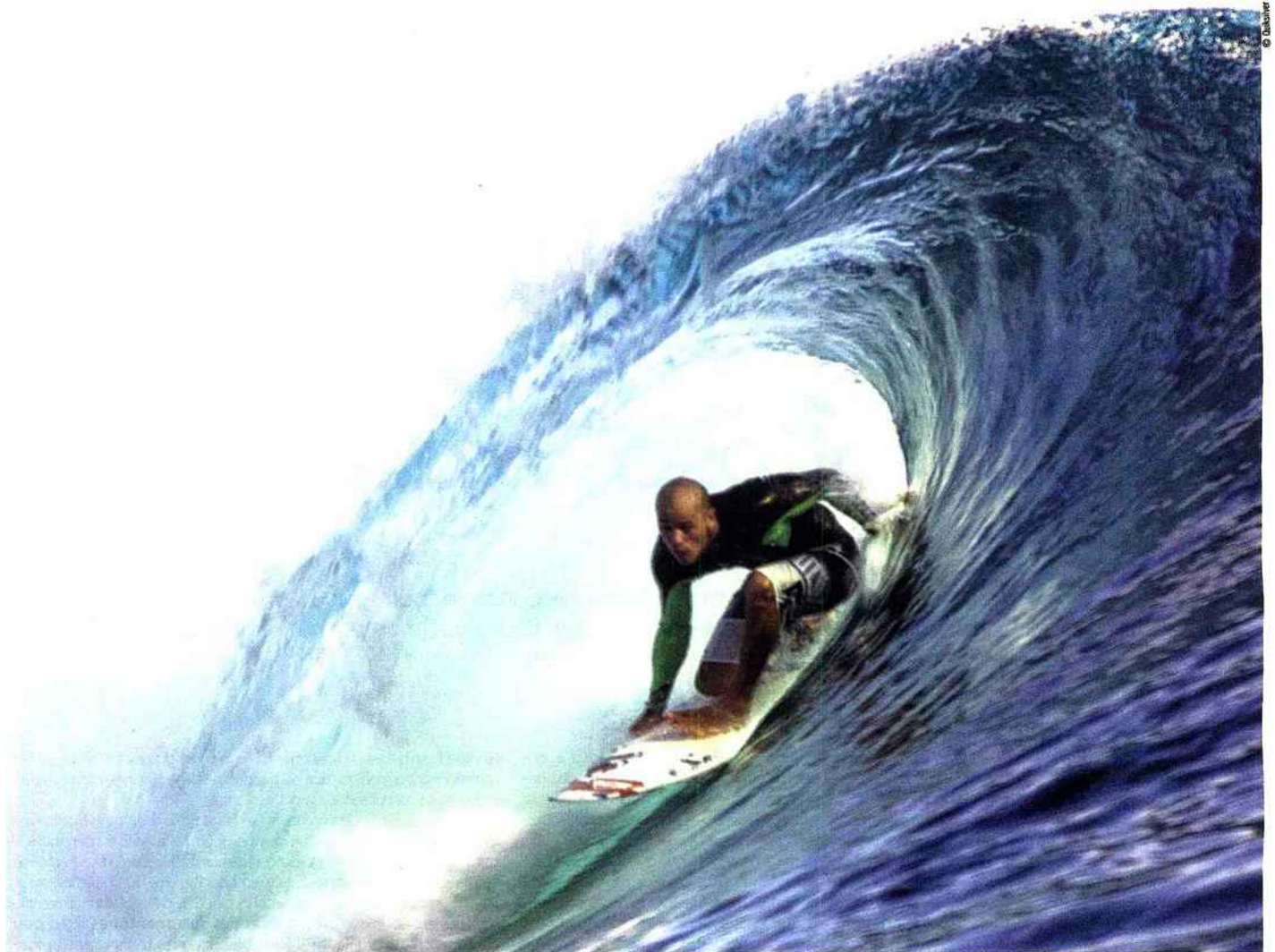
Le film Tahiti 3D destination surf 1 montre Kelly Slater s'attaquant aux plus belles vagues de l'île polynésienne